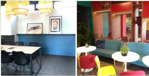
Vacouva 43 Quai de Malakoff 44000 Nantes