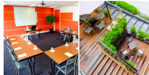
Chateauform' République 8 Bis Rue de la Fontaine au Roi 75011 Paris